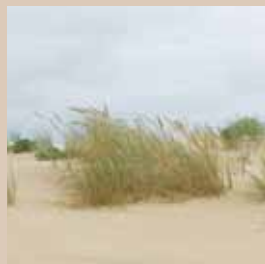
Dunes de sables